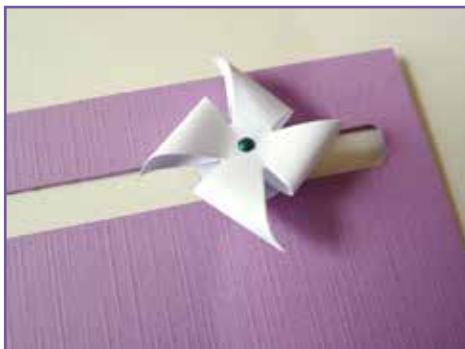
7. Collez le moulin au-dessus des pièces.