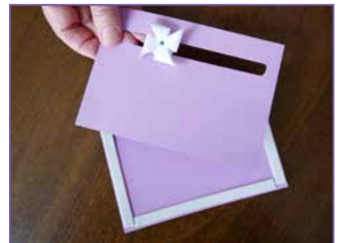
9. Collez la carte tourniquet au-dessus de cela.