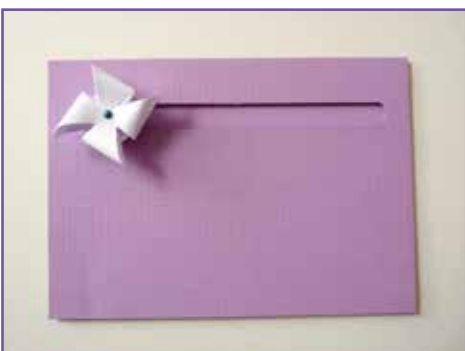
10. Le résultat.