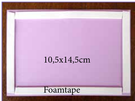
8. Mettez de la mousse adhésif sur la carte de fond.