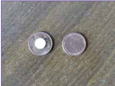
4. Mettez de la mousse auto-collante onde sur une pièce de 2 cent.