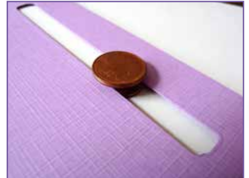
6. Mettez cela entre les fentes.