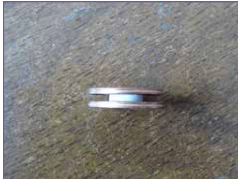
5. Mettez l'autre pièce au dessus de cela.