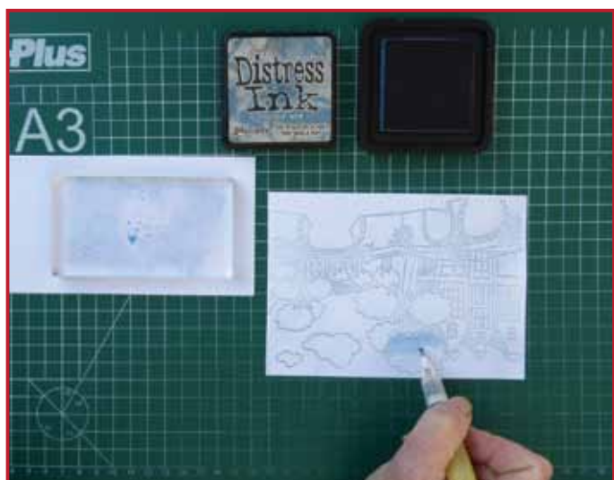
5. Prenez une peu de couleur plus sombre avec votre pinceau à eau et colorez les parties en tournant de gauche à droite.