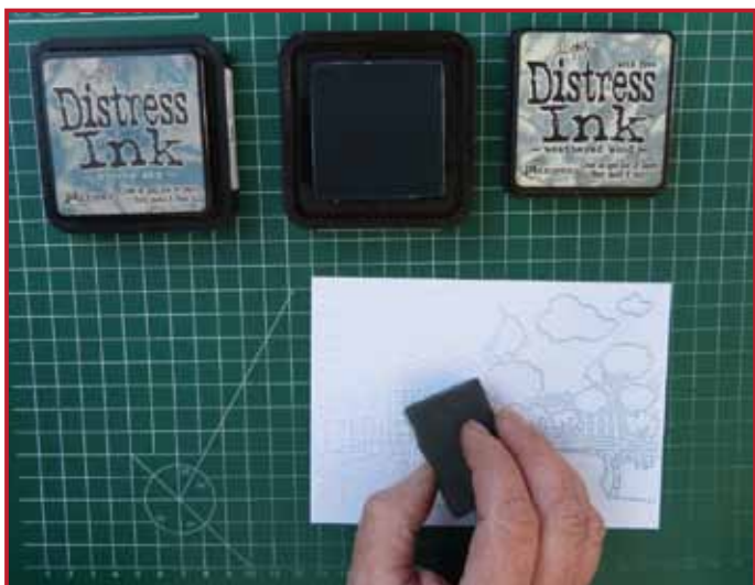
3. Colorez toute la carte avec la couleur la plus claire et une éponge.