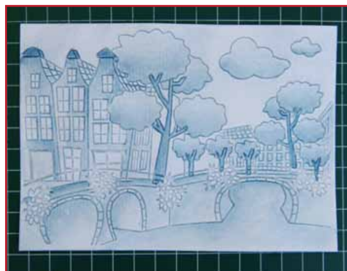
6. Voilà le résultat!

Regardez les films sur: www.nellies-choice.com/index.php/fr/filmpjes