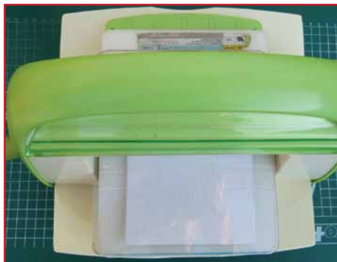
2. Embossez la carte blanche à l'aide du Picture Embossing Folder.