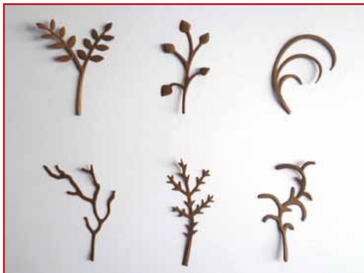
3. Ces formes peuvent être utilisées sur vos cartes.