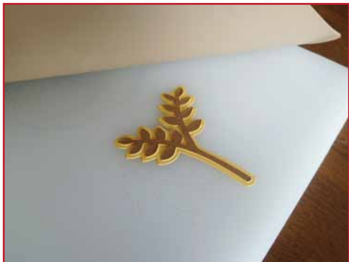
4. Vous pouvez passer les formes à nouveau à travers la machine avec le tapis d'embossage.