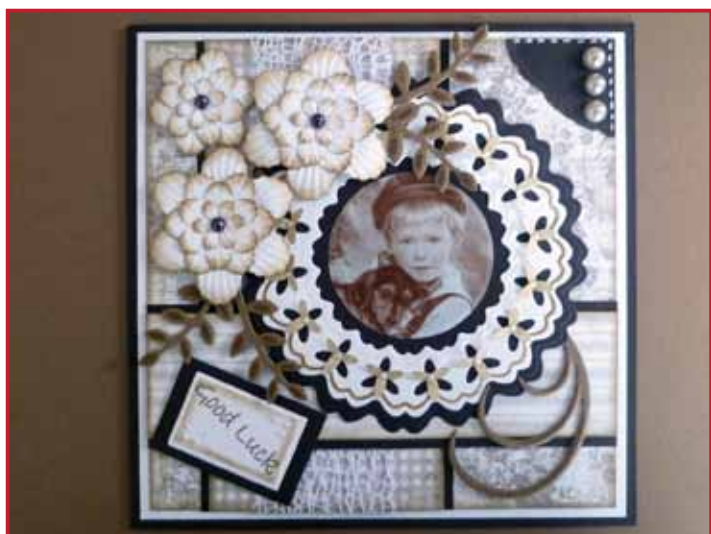
6. Fabriquez une jolie carte.

Regardez les films sur: www.nellies-choice.com/index.php/fr/filmpjes