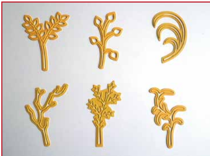
1. Il y a 6 formes différentes de brindilles disponibles.