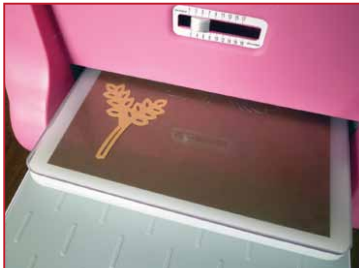
2. Découpez la forme en utilisant une machine.