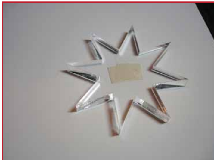
2. Collez la forme étoile avec de l'adhésif repositionnable. (ou avec de la pâte collante)