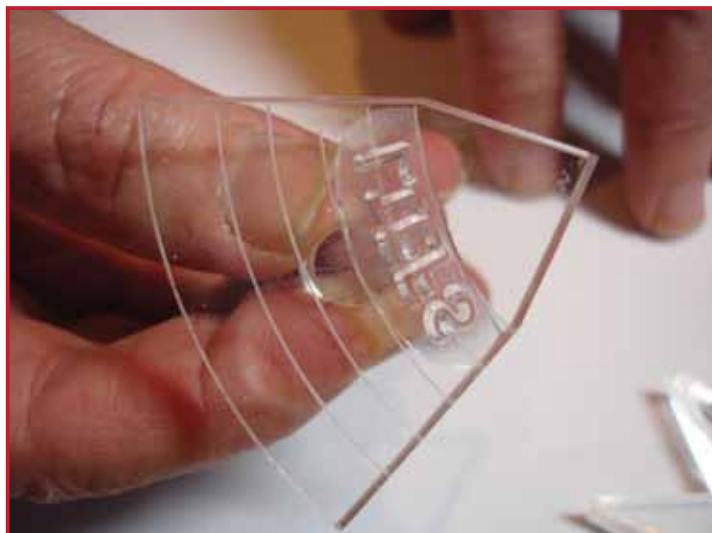
3. Mettez le tampon clear sur le bloc précision.