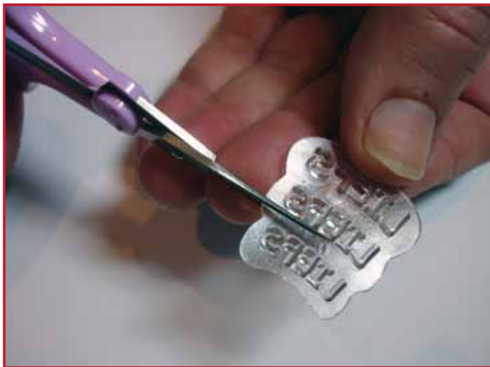
1. Découpez le tampon clear.