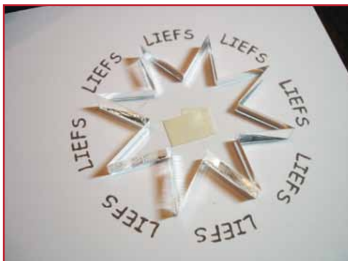
5. Tamponnez ainsi tout le tour.