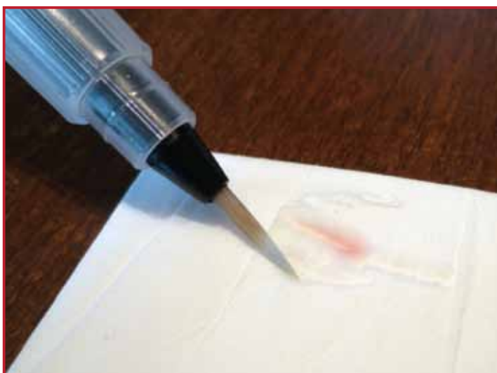
5. Essuyez après chaque couleur votre pinceau sur un mouchoir.