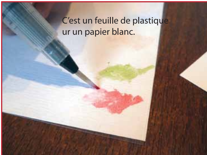
3. Déposez de l'encre avec le marker Memento sur une feuille transparente et en prendre avec votre pinceau.