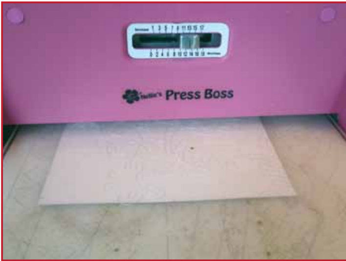
1. Embossez un morceau de papier aquarelle