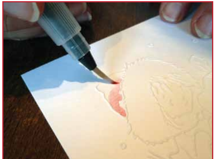
4. Colorez l'image embossée comme vous le souhaitez. Faites cela avec des mouvements circulaires et commencez où la couleur doit être la plus sombre.