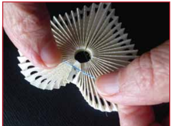
6. Attirez le fil et fixez-le avec un noeud double.