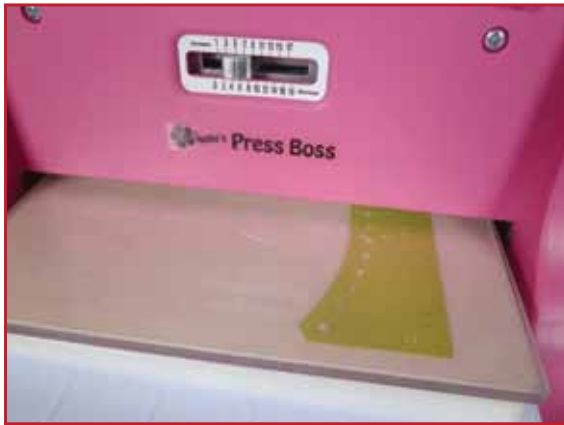
1. Coupez la Folding Die avec la machine.