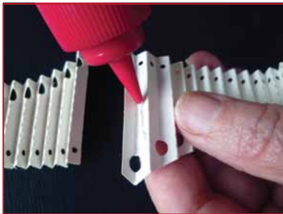
3. Collez les bouts extérieurs ensemble.