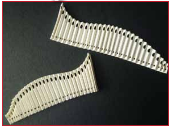
2. Coupez 2 pièces et pliez-les le long des lignes comme un accordéon.