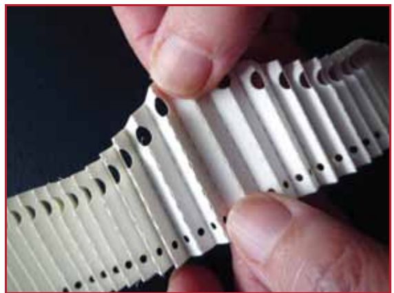
4. Bien presser ensemble et plier de nouveau.